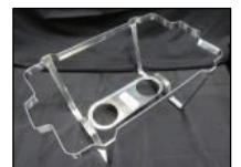
1 cadre 1 frame