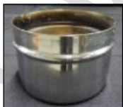
2 tasses de brûleur 2 burner cups

IMPORTANT: Please verify that all of these pieces are present when returning the machine. Additional charges will be applied for missing parts.