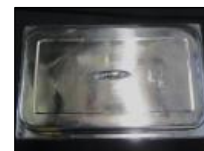
1 couvercle de réchaud 1 chafer cover