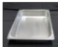
panne(s) de nourriture food pan(s)