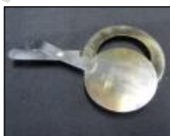
2 couvercles de brûleur 2 burner covers