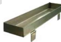
1 water pan 1 plat d'eau